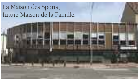
La Maison des Sports, future Maison de la Famille.

Après les perturbations liées aux travaux d'assainissement réalisés en centre ville et la réfection des chaussées suite aux dégâts de l'hiver, les Saint-Cyriens ne subiront pas d'autre désagrément de circulation. Deux ralentisseurs seront installés sur la contre-allée Barbusse et la signalisation horizontale sera rafraîchie sur le domaine public à la rentrée. Les promeneurs ne seront pas oubliés avec la fin des travaux d'aménagement du terrain communal , situé chemin de la Ratelle. Lieu propice à la promenade, cet espace retrouvera rapidement sa quiétude grâce à la mise en place d'une ceinture de protection anti-intrusion. Sa nouvelle architecture vallonnée et sa végétalisation le rendront bientôt encore plus attractif pour les Saint-Cyriens.