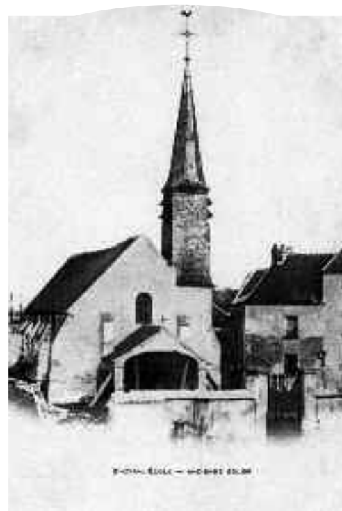
C'est dans l'église de Saint-Cyr que se déroula la première élection du maire de la commune en 1790.