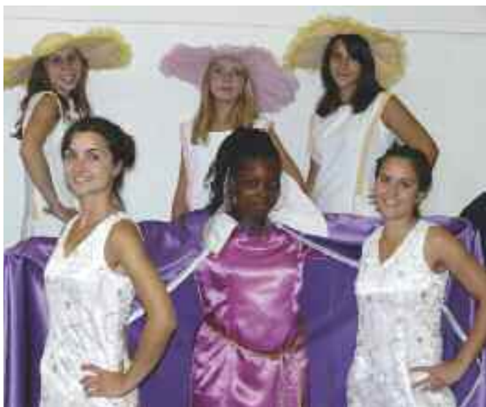
36 artistes vous donnent rendez-vous pour un voyage à travers le temps dans la comédie musicale "Remember".