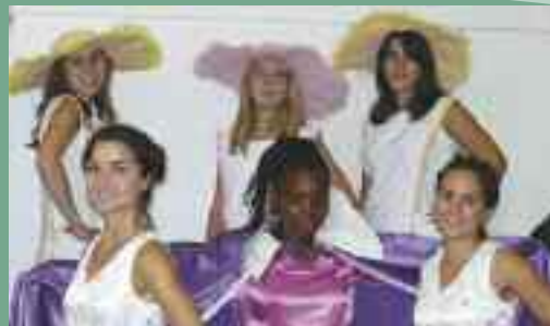
Association "Remember" l'Amicale Laïque