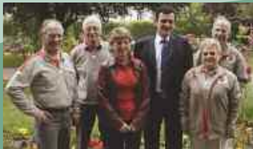
Croix Rouge Un écrivain public à votre service