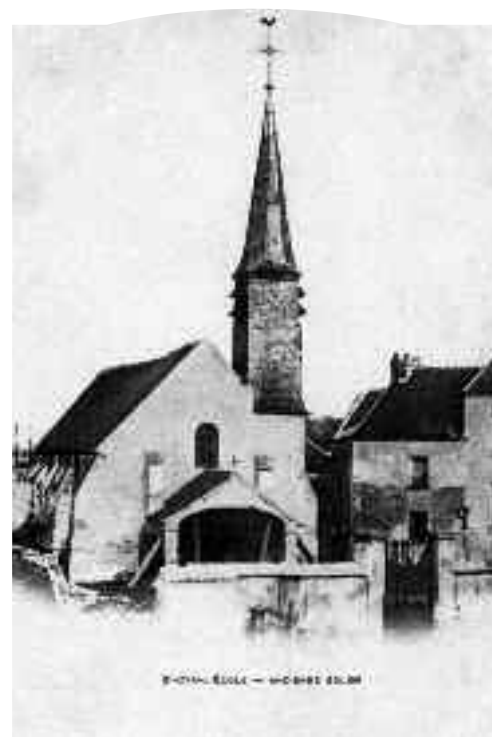
C'est dans l'église de Saint-Cyr que se déroula la première élection du maire de la commune en 1790.