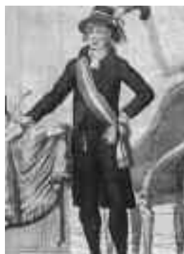
Costume officiel de maire.